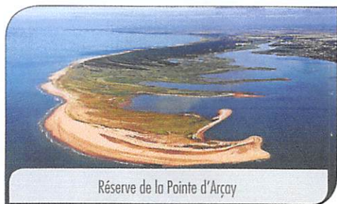
Réserve de la Pointe d'Arcay

La réserve de la Pointe d'Arcay s'étend sur 580 ha. Côté terre, une forêt domaniale est classée en « Réserve biologique » en 1982 par l'Office National des Forêts (ONF). Ce statut a pour objectif la mise en valeur et la protection des richesses naturelles présentes sur le site. Afin d'y protéger la faune, « une Réserve de chasse et de faune sauvage (1973) » limite l'accès au site, ainsi que la pratique de la chasse.