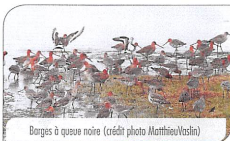
Barges à queue noire

Qui dit diversité d'habitats naturels, dit diversité d'espèces. Côté mer, c'est sur la dune que l'on retrouvera de nombreuses plantes protégées comme l'Œillet des dunes. La laisse de mer est la zone de reproduction du Gravelot à collier interrompu. Il va dissimuler ses œufs au milieu des coquillages et autres débris et y élever ses jeunes. Une chance,