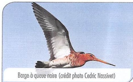
Barge à queue noire

Côté estuaire du Lay, des rassemblements importants de barges à queue noire, de courlis cendrés, de bécasseaux maubèches font des voyages entre la Réserve Naturelle de la Baie de l'Aiguillon et les rives du Lay pour se reposer ou s'alimenter sur les vasières. Au printemps, l'emblématique Gorge-bleue à miroir colonise le pré salé pour parader.